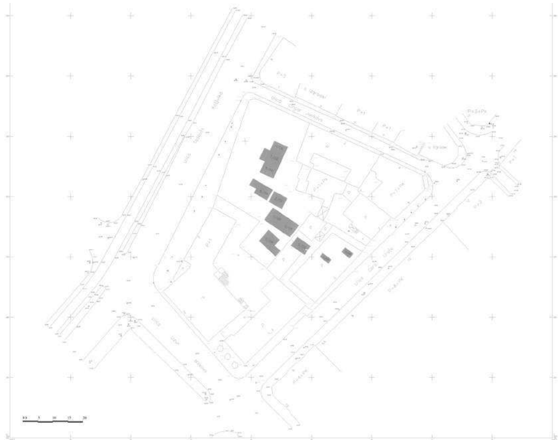
Figure 1 – Situa- tion plan of the site in Cincar Jankova street

Слика 1 – Ситуациони план налазишта у Цинцар Јанковој улици