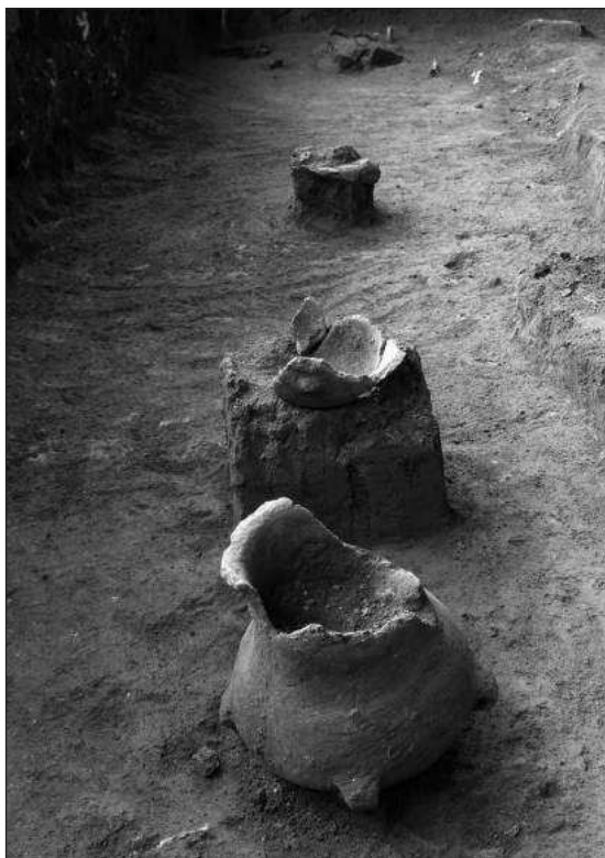
Слика 5 – Ред урни на некрополи из позног бронзаног доба у сонди 2

Откриће дела римске некрополе са спаљеним покојницима отвара и питање да ли се овај простор од средине I до среди-