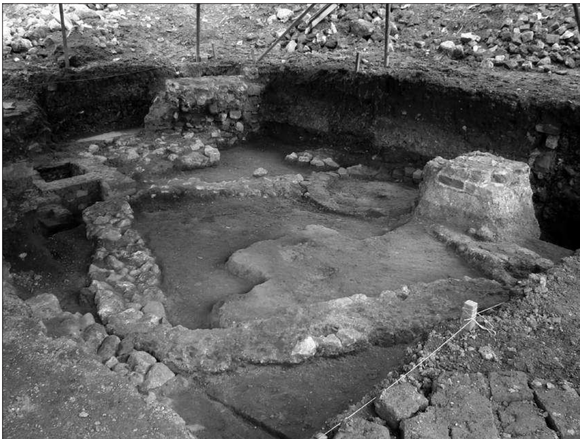
Слика 2 – Темељна зона објекта из IV века

Figure 2 – Founda- tion area of a 4th century AD object