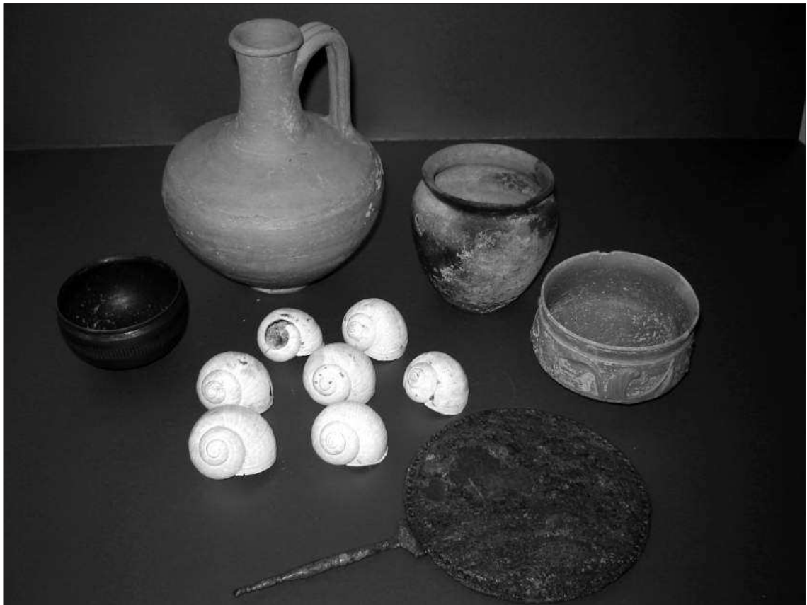
Слика 4 – Налази из гроба Г-1